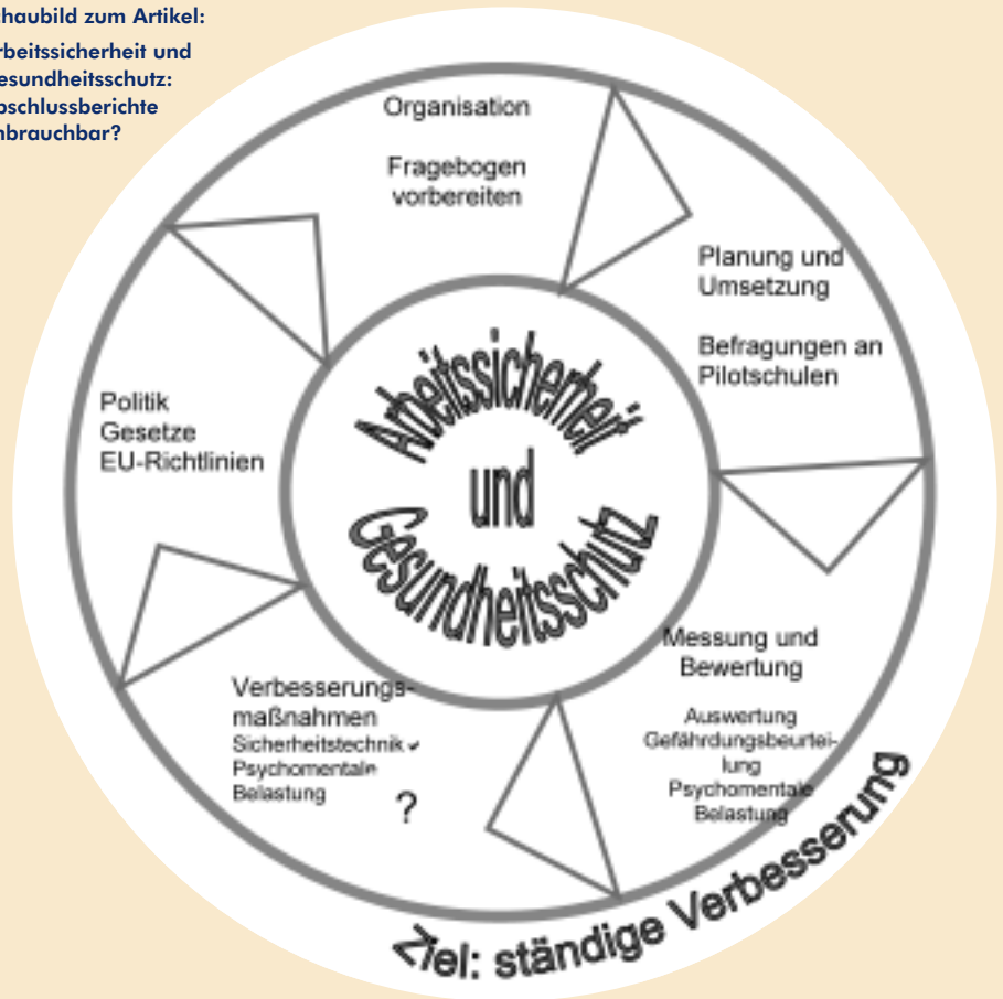
Schaubild zum Artikel: Arbeitssicherheit und Gesundheitsschutz: Abschlussberichte unbrauchbar?